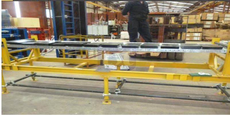
Şekil 4. Düzgün yayılı yük deneyi

Her bir platform birimi Çizelge 5’de yer alan düzgün yayılı yük q_1 ’i taşıyabilecek kapasitede olmalıdır [7]. Belgelendirme incelemesi yapılan firmada H tipi iskelede kullanılan platformların yapılan deneylerde yük sınıfı 4’ e göre çizelge 5’te verilen 3,00 \text{ kN/m}^2 yükü taşıdığı görülmüştür.