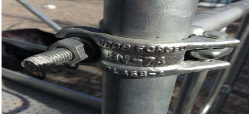
Şekil 9. Birleştirme elemanı

Bağ kelepçeleri, TS EN 74-1 standardının şartlarını sağlamalıdır [12]. Belgelendirme incelemesi yapılan firmada birleştirme elemanı ile ilgili TSE Makina Laboratuvarına yaptırılmış uygun test raporu görülmüştür.