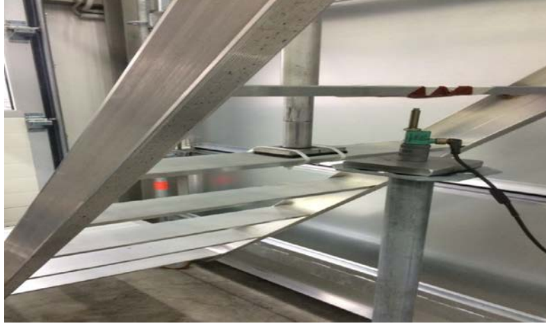
Şekil 5. Merdiven deneyi

Belgelendirme incelemesi yapılan firmada merdiven deneyinde çelik merdivenin 1,5 kN'luk tekil yükleme ve 1,0 kN/m 2 lik düzgün yayılı yüklemeye dayanıklı olduğu görülmüştür.