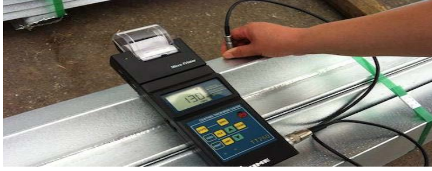
Şekil 8. Galvaniz kalınlığı ölçümü