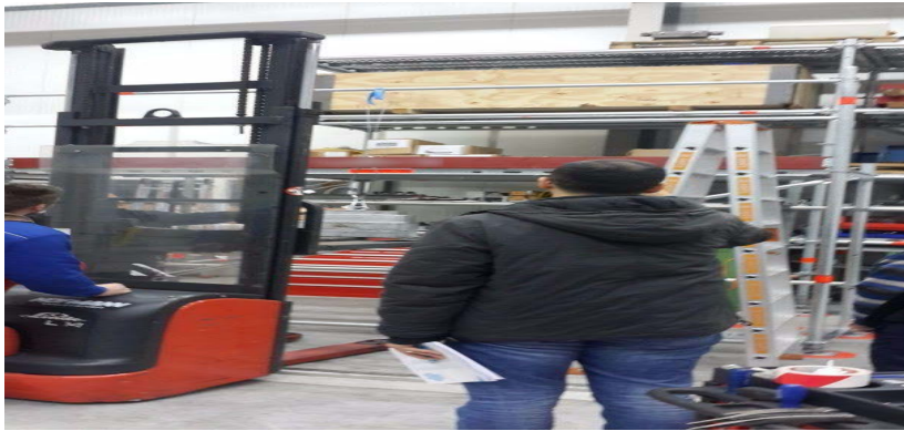
Şekil 6. Yan koruma düşey sehim deneyi

Herhangi bir ana veya ara korkuluk mesnetlenme yönü önemli olmaksızın 1,25 kN'luk tekil bir uygulanması durumunda herhangi bir noktadan 300 mm'den fazla bir sehim yapmamalıdır [5]. Belgelendirme incelemesi yapılan firmada H tipi iskelelerde kullanılan korkulukların 1,25 kN noktasal yüke dayandığı görülmüştür. Meydana gelen azami sehim değeri 15 mm olmuştur.