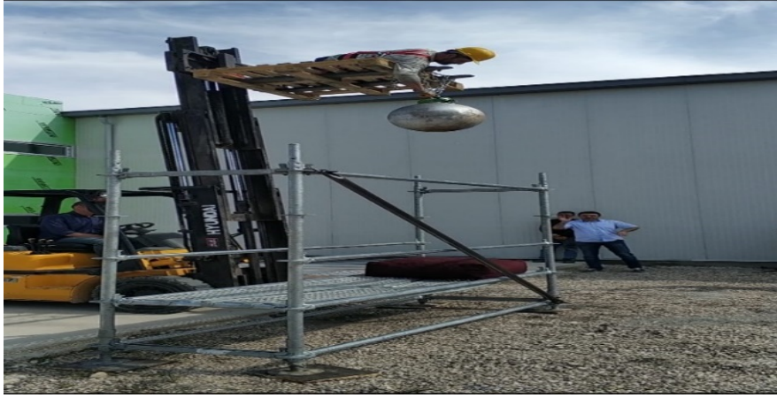
Şekil 1. Düşme deneyi

Düşme deneyi ile amaç platform ve mesnetlerinin düşme etkisi ile oluşacak direncini test etmektir. Bu deney 0,5 m çapa ve 100 kg lık bir ağırlığa sahip çelik bir kürenin 2,5 m yükseklikten platforma bırakılması ile gerçekleşmektedir. Çelik kürenin platformu üzerine düşeceği alana 0,5m x 0,5 m ebatlarında kalınlığı 0,25 m den fazla olmayan bir minder konulur. Deney üç kez tekrarlanabilir ve çarpma noktaları farklı olmalıdır. Her bir deney düzeneği için yeni bir platform kullanılabilir [7]. Belgelendirme incelemesi yapılan firmada yapılan düşme deneyinde düzeneğin çelik bilye ile uygulanan yükü taşıdığı görülmüştür. Deney sonrası platformda kabul edilebilir kalıcı şekil değiştirme olmuştur. Ancak herhangi bir kopma ve yırtılma olmamıştır.