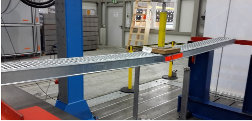
Şekil 3. Tekil yük deneyi