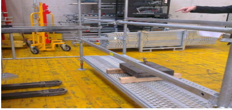
Şekil 7. Yan koruma yatay sehim deneyi

Yan korumalarda topuk tahtası hariç diğer tüm bileşenler 0,3 kN'luk yatay noktasal yüke dayanacak biçimde tasarlanmalıdır. Topuk tahtası için bu yük değeri 0,15 kN'dur. Ana korkuluk, ara korkuluk ve topuk tahtası yatay yüklere maruz kaldığında en fazla 35 mm sehim yapmalıdır [5]. Belgelendirme incelemesi yapılan firmada yan korumaların 0.3 kN'luk yatay nokta yüke dayandığı görülmüştür. Meydana gelen azami sehim değeri 15 mm'dir. Topuk tahtasında ise 16 mm sehim olmuştur.