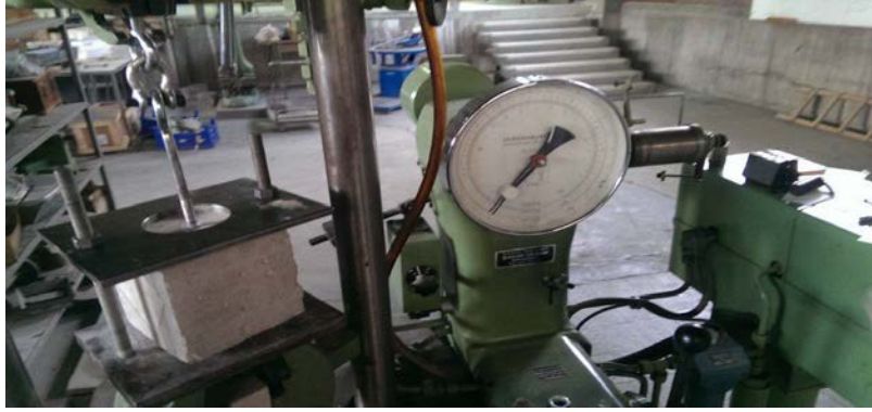
Şekil 10. Aderans kuvvet ölçümü